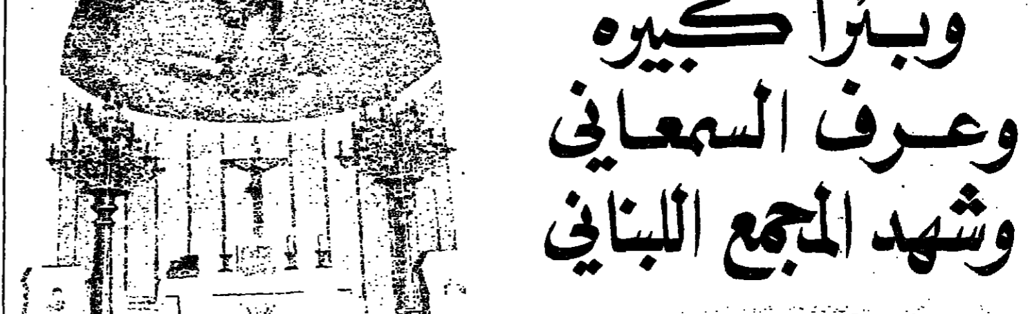
لوحة السيدة العذراء الابائي بطرس في

دير اللويزة ويسوع الملك الذي شاده رجل الله البار القديس يعقوب الكورسي لخدمة الكهنة من كل الطوائف في ايام مرضه . وهذا الدير يشرف غربا على سواحل كسروان والبحر ومدينة بيروت وعلى ما يبلغ اليه الطرف ، وشمالا على خليج جونيه الذي يحده جبل سيدة حريسا الساطق في البحر تفصله عنه اقل من الفخفرة بالزروع الجميلة ، ثم خليج جبيل فالتلثرون ، وشرقا جبل صنين المممة بالثلج ومصايف كسروان الالقة . وجنوبا جهات اكن ومصايف الجبيلة المنتشرة بين الاحراج والصخور الرمادية وتراء البارزة بسطوحها القريبية الحمراء ، ويحيط به من كل جهات شجر اللوز والصنوبر والزيون والليمون . ويلى ذلك لجهة الغرب وادي نهر الكلب الذي يخرق بين الارض فيصنعها الى شطرين عظيمين مستقيمين ، التسن والقطاع وكسروان .